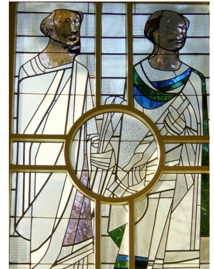
Judas Thaddeus en Matthias

Judas Thaddeus zou gewerkt hebben in Palestina en Mesopotamië en met een knots gedood zijn. Dat is dan ook zijn attribuut. Zijn dag is 28 oktober. De brief van Judas wordt aan hem toegeschreven.