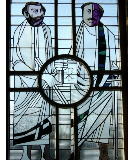
Andreas en Mattheus

Andreas. Hij is een van de eerste discipelen van Jezus en hij haalt zijn broer Petrus er ook bij. Hij zou in Griekenland aan een z.g. Andreas -