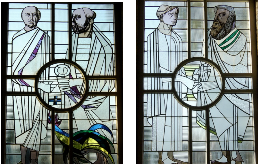
Jacobus de Meerdere en Simon Petrus Johannes en Jacobus de Mindere

Simon Petrus. Hij wordt beschouwd als de eerste onder de apostelen. Als attributen heeft hij een sleutel, omdat Jezus aan hem "sleutelmacht" gegeven zou hebben, en de haan, die verwijst naar zijn verloochening van Jezus aan de vooravond van Goede Vrijdag. zijn graf bevindt zich onder de Sint Pieterskerk in Rome, waar hij op 29 juni 67 omgekeerd gekruisigd zou zijn.