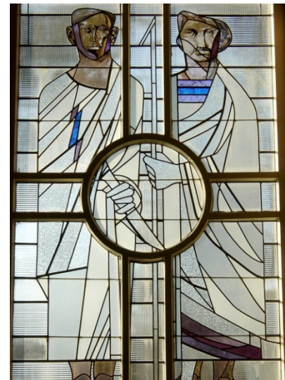
Bartolomeus en Filippus

Filippus heeft velen tot Jezus gebracht. Vandaar de herdersstaf als attribuut. Hij zou gewerkt hebben in Zuid-Rusland en Klein-Azië, waar hij in Hiërapolis gestenigd werd. Zijn dag is 1 mei.