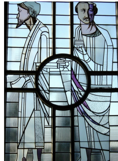
Thomas en Simon Zelotes

Simon Zelotes (= de ijveraar). Hij zou in Noord-Afrika werkzaam geweest zijn en zijn doorgezaagd.. Vandaar de zaag in zijn hand. Zijn dag is 28 oktober.